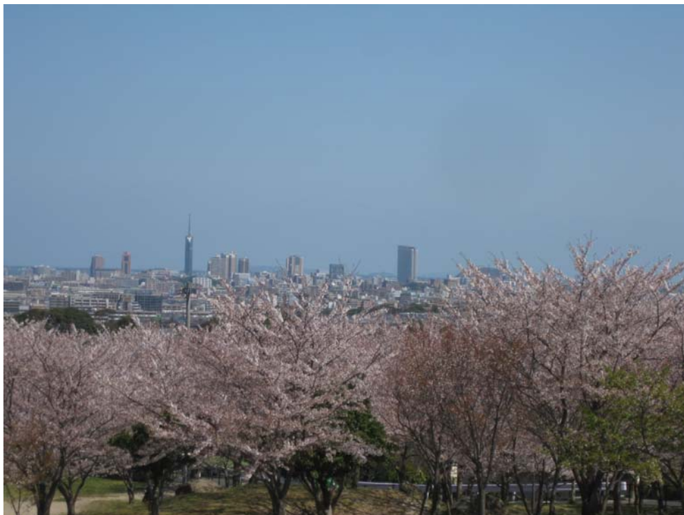
西油山中央公園から福岡タワー、旧シーホーク、ヤフードーム遠望