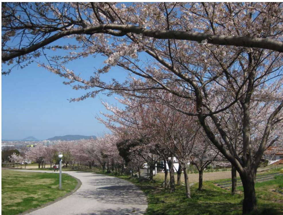
徳栄寺の近くの西油山中央公園桜：後方には玄界島（左）、能古島（右）が遠望できる