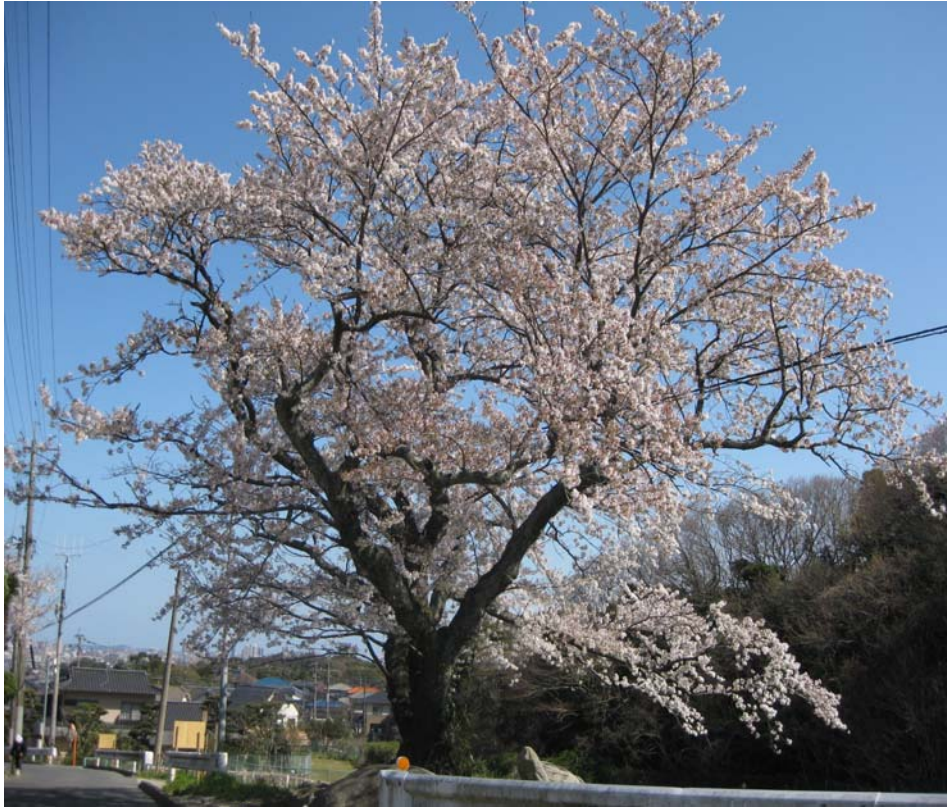
徳栄寺途中にある僧坊（鬼塚）跡の1本桜