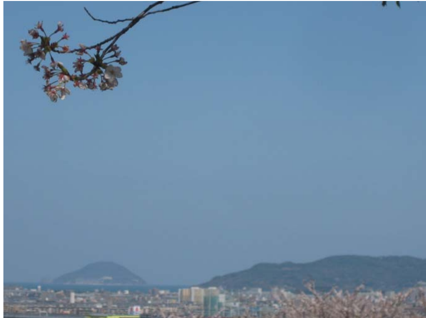
徳栄寺の近くの西油山中央公園桜：後方には玄界島（左）、能古島（右）が遠望できる