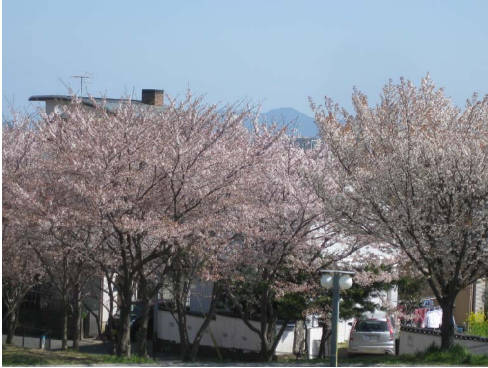
西油山中央公園より立花山遠望