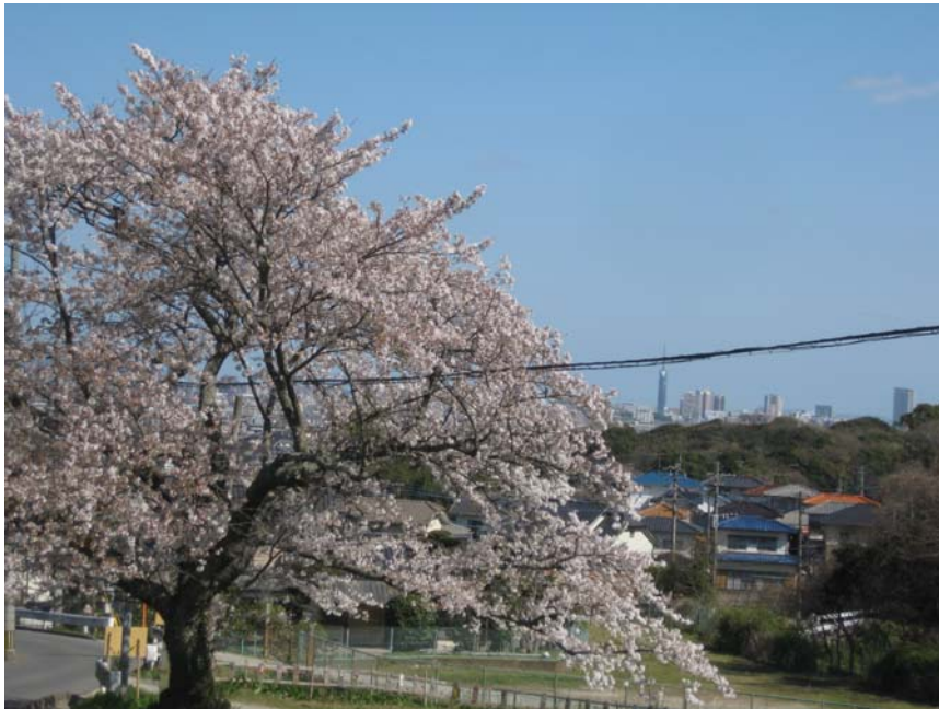
一本桜後方には福岡タワー、旧シーホークが遠望できる