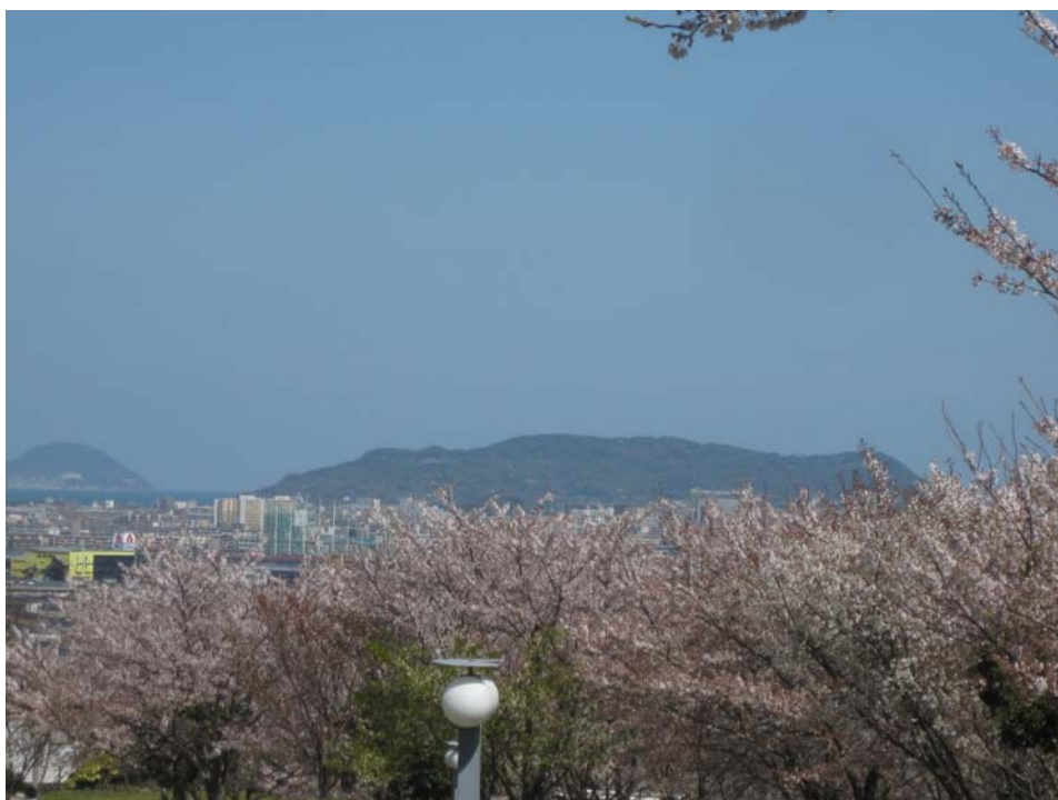
徳栄寺の近くの西油山中央公園桜：後方には玄界島（左）、能古島（右）が遠望できる