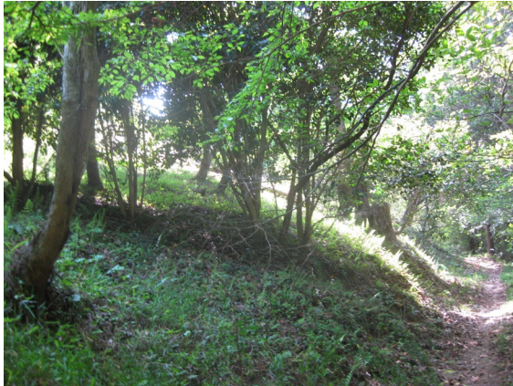
武者隠しの場所付近