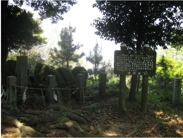
天拝山山頂：天拝山城址