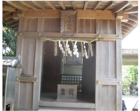
天拝山山頂の天拝山社