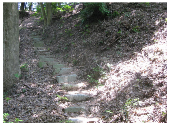
飯盛城址への石段