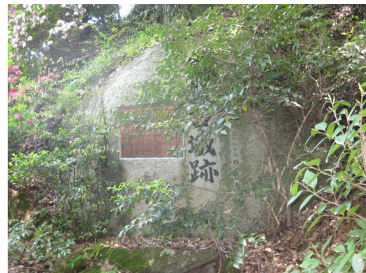
飯盛城址の説明板