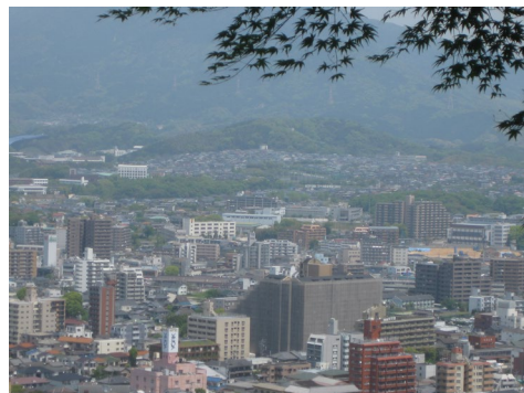
荒穂神社より宝満山方面を遠望