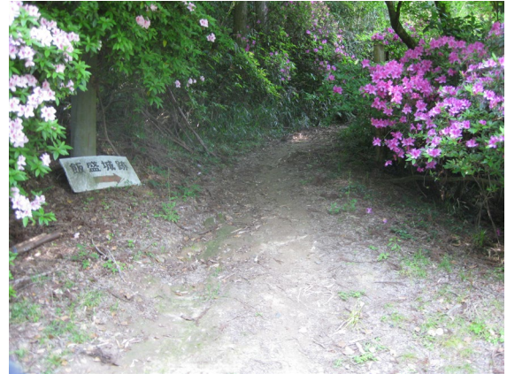
飯盛城址出口と出発地（アラスカレストラン入口）