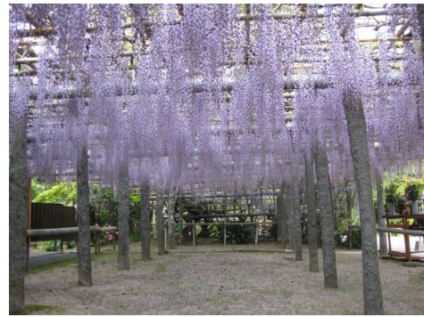
武蔵寺の長者の藤