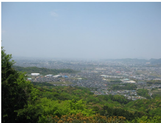
天拝山城址からの筑紫野市を望む