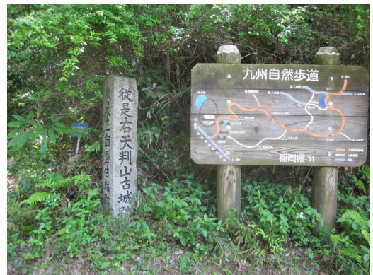
飯盛城址と天拝山城址の分岐点