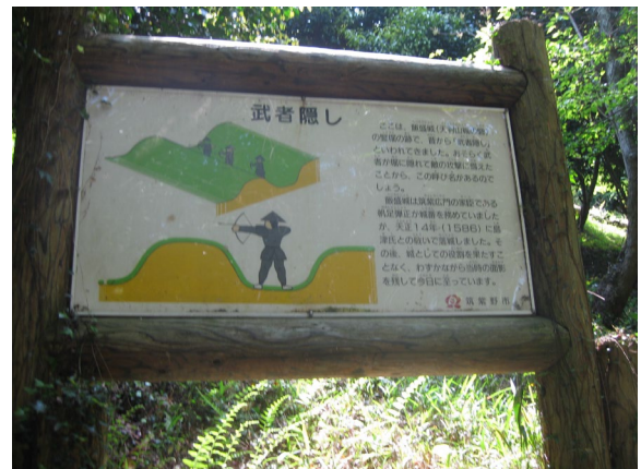
飯盛城址の下にある武者隠しの説明板