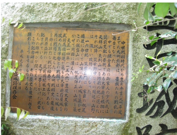
飯盛城址の説明板