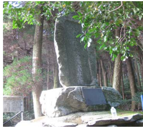
靈仙寺境内にある日本最初の茶栽培発祥地の碑