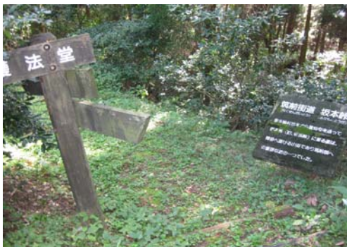
つぎの分岐 (左上へ)