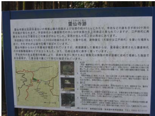
駐車場横の霊仙寺入口にある説明板