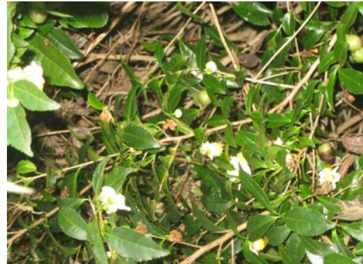
茶園の茶の実と花