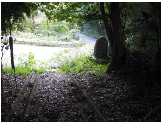
説明板から少し登った所からの旧道 (385 線)