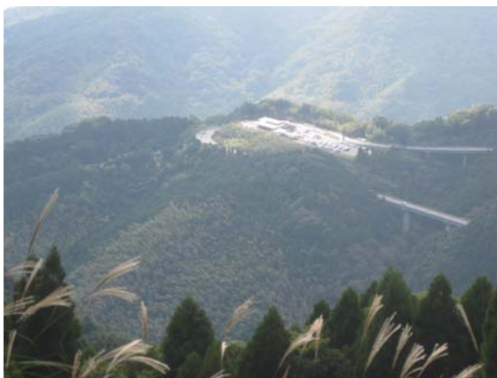
靈仙寺境内から「道の駅 吉野ヶ里」遠望