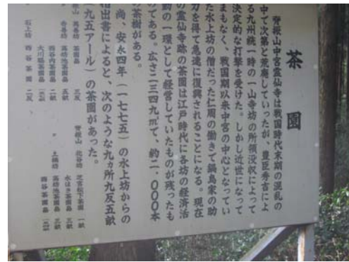
駐車場横の霊仙寺入口にある説明板